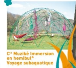
C o Muziké Immersion en hémibul o , Voyage subaquatique