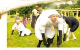
Cie Corpus, les moutons, les vacances à la campagne