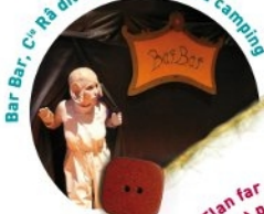
Bar Bar, C o Ra dit Bleu, Le café du camping

La Flan far aux pruneaux, Fanfare, c'est pas du gâteau