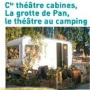
C o théâtre cabines, La grotte de Pan, le théâtre au camping

L'hémisphère de l'ouest, Totem, fin de soirée au coin du feu