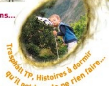
Traouait TP, Histoires à dormir, qu'il est bon de ne rien faire...

Séné Rail Miniature, Vapeur vive, Attention au départ !