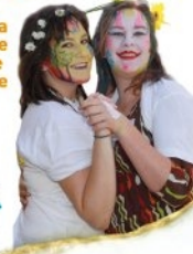
C o Ocus, du fil à retordre, les vacances ne sont pas cousues de fil blanc

C o Dginkobiloba maquillage pour faire sourire la vie