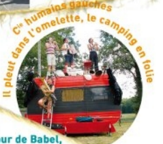
Il pleut dans l'omelette, le camping en folie