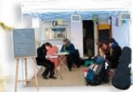
C o Kiroul, La honte de la famille, souvenirs de vacances

La Caravane C o , Auteurs Publics, Atelier d'écriture de cartes postales