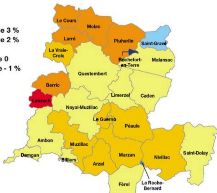
Evolution annuelle de la population des communautés de communes de Questembert et Muzillac entre 2011 et 2016.